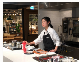
グループも個人レッスンも お任せください。

料理の辻家5代目による料理レッスンも好評を頂いております。私どものキッチンスタジオだけでなく、各企業様のキッチンスタジオや貸キッチンに出張してレッスンも行うこともできますので、こちら是非ご相談ください。和食・中華・フレンチなど料理のご希望をお聞かせ頂き、楽しい時間を一緒に作り上げられたらと思っています。