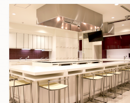
近鉄あべのハルカス校は最新 設備・機器を備えています。

各企業様の商品を活かしたレシピを考案し、辻ウェルネスクッキング近鉄あべのハルカス校等でレッスンイベントを開催。各企業様の商品のPRのお手伝いをさせて頂いております。また商品の説明書やパッケージに載せる料理画像や、商品を購入頂いた方への商品の紹介動画などの作成も承っております。是非ご相談ください。