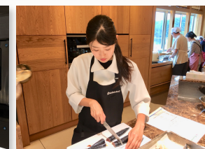
出張レッスン。材料もこちら で準備することも可能です。