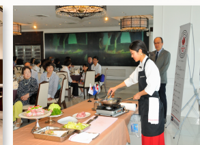
ホテル等を会場としてイベント を行うことも可能です。