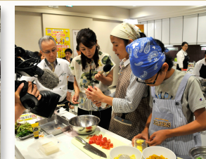
南かおりさんが司会を 担当していただきました。