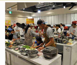
コロナ前の様子です。 非常に盛り上がりました。

辻ウェルネスクッキング企画のTV番組。令和4年で第30回を迎えます。親子が力を合わせて料理競技を行う番組です。料理の技だけでなく、親子の絆や食育につながるあたたかい番組です。審査員には各メディアでご活躍の佐川進先生・林裕人シェフ・辻ヒロミ先生も登場。カナダ領事館はじめ、多くの企業様に協賛・協力を頂いております。是非、御社の商品をメディアで発信しませんか？